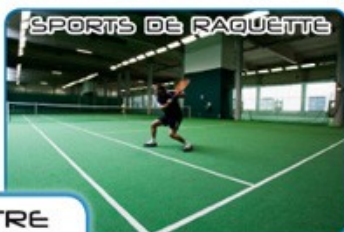
SPORTS DE RAQUETTE